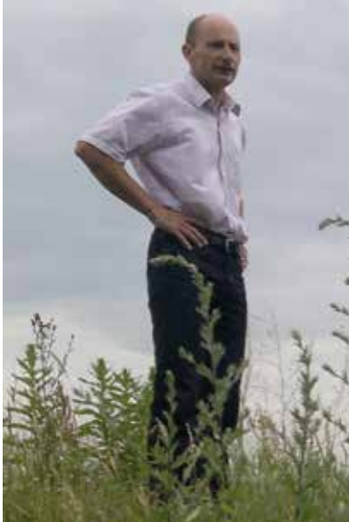
Remco Barkhuis Havenbedrijf Amsterdam