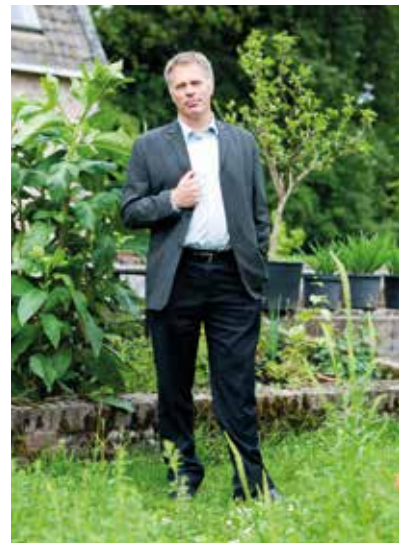
Hank Bartelink Landschappen NL (voorheen De12Landschappen)