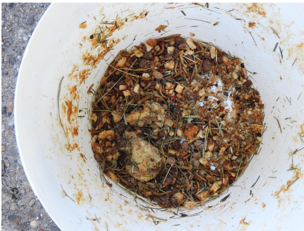
Foto 4. Muizenval.