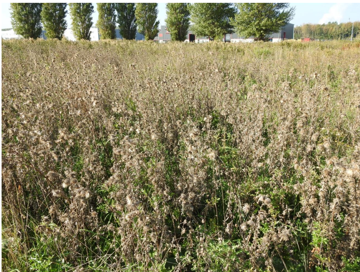
Foto 6. Terrein gronddepot 1 en 2.