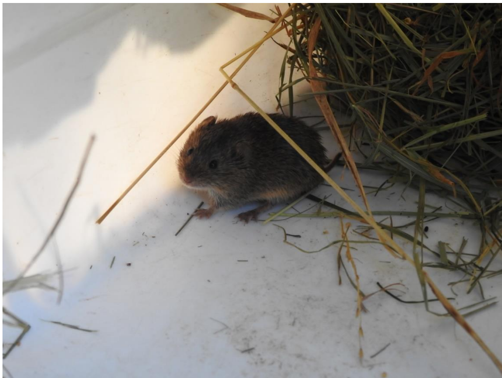
Foto 3. Voer.