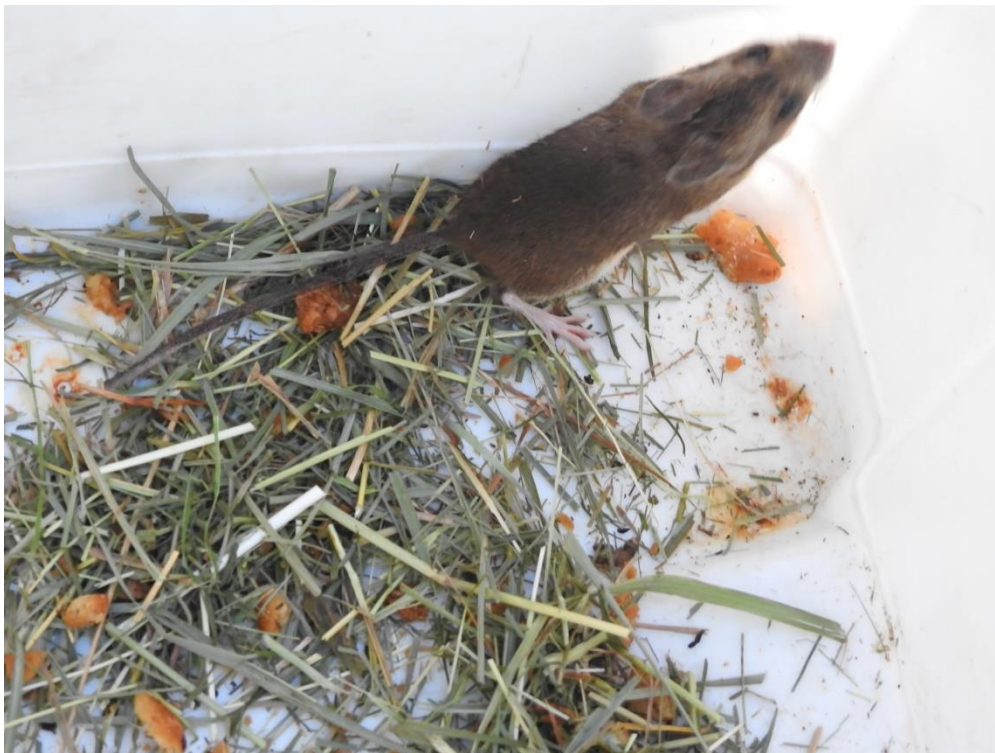
Foto 2. Veldmuis